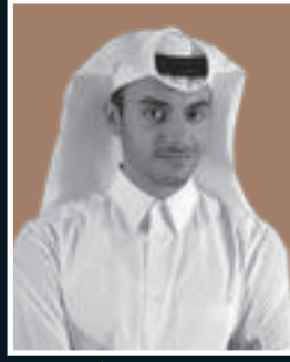
الشيخ سحيم بن عبدالله آل ثاني نائب رئيس مجلس الإدارة