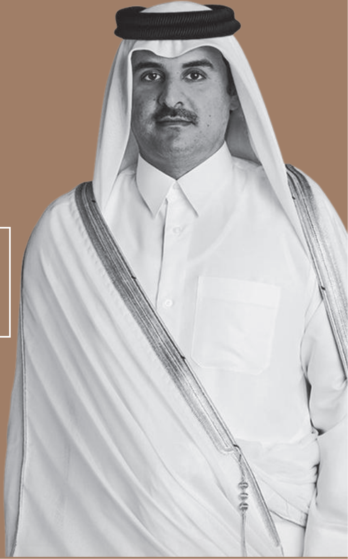
حضرة صاحب السمو الشيخ مهيم بن حمد آل ثاني أمير دولة قطر