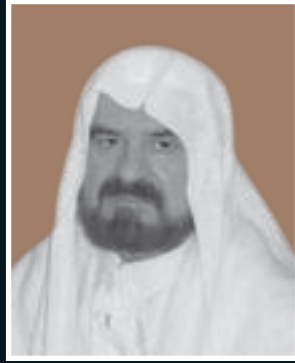
أ.د. علي القره داغي الرئيس والعضو التنفيذي لهيئة الفتوى والرقابة الشرعية